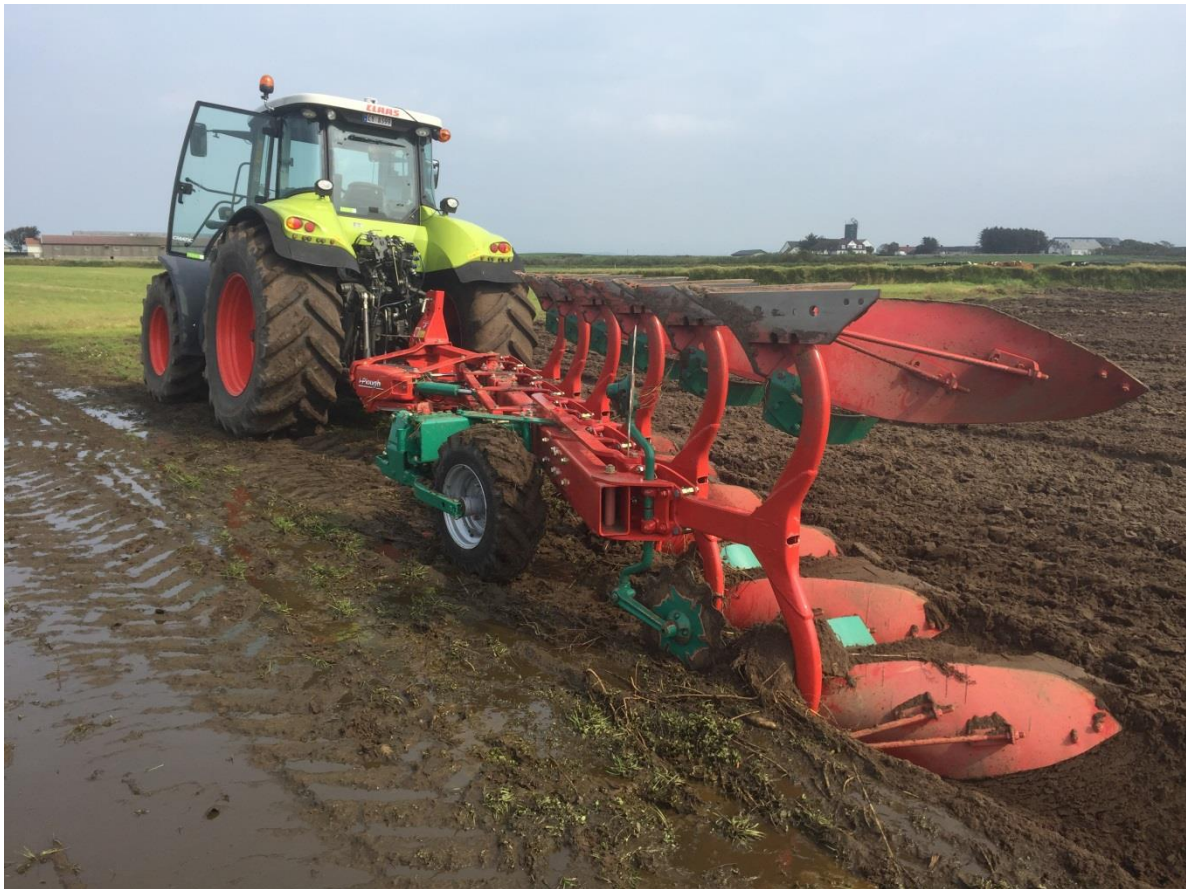
Kv 2500 i-Plough® nuova ruota avanzata

Kverneland ha sviluppato una nuova ruota avanzata per il 2500 i-Plough®, con questo nuovo accessorio sarà possibile lavorare non avendo l'ingombro della ruota posteriore in caso di finiture dei campi o in presenza di ostacoli.