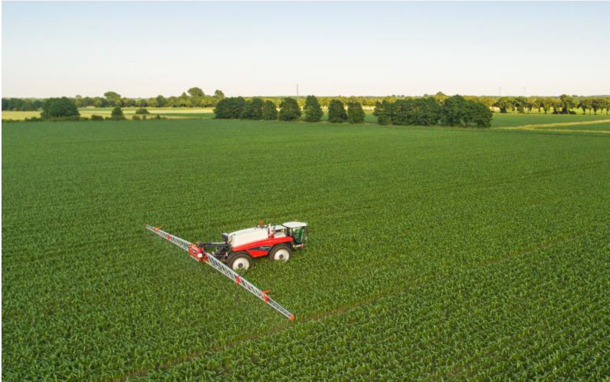
Kverneland iXdrive con EcoDrive, nuovo Boom Guide ProActive e nuovo sistema di sicurezza per la barra

Kverneland ha introdotto tre nuove importanti opzioni per la gamma di semoventi da diserbo iXdrive.