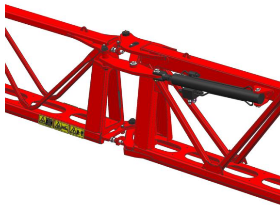
Cilindro idraulico tra la prima e seconda sezione di barra

Kverneland ha sviluppato un sistema brevettato ed unico di sicurezza in caso di ostacolo per le barre HSS da 32-40 metri. Un cilindro idraulico posizionato tra la prima e seconda sezione di barra permette alla seconda di ripiegarsi. In questo caso il danneggiamento della stessa sarà evitato. La combinazione tra BreakAway e BoomGuide ProActive permetterà all'operatore di concentrarsi solo sul lavoro da svolgere.